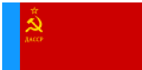
Флаг Дагестанской АССР 1934—1991 гг.

Форма и порядок использования Государственного флага РД установлены Положением "О государственном флаге Республики Дагестан", утвержденным Верховным Советом РД 24 февраля 1994