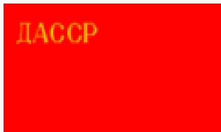
Дагестанской АССР 1925 г.