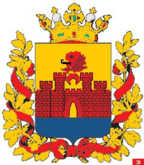
гербовника П. П. Винклера)

нашествиями иранских и турецких завоевателей на Дагестан, его правители стали искать защиты у России, многие просили принять их в русское подданство. Правительство России возвело целый ряд крепостей на побережье Каспия: в устье Терека, Судака, Сушки и так далее.