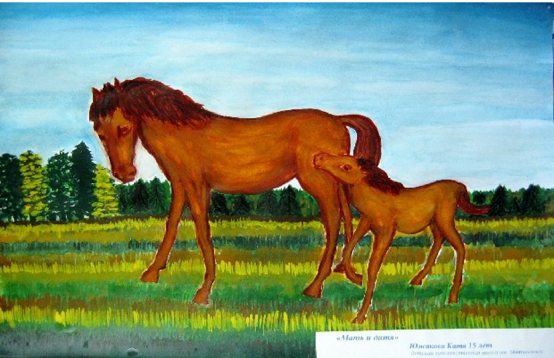
«Мать и дитя»