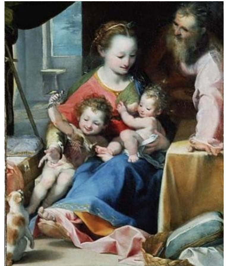
Рембрант «Мадонна с младенцем и Св. Иосифом»