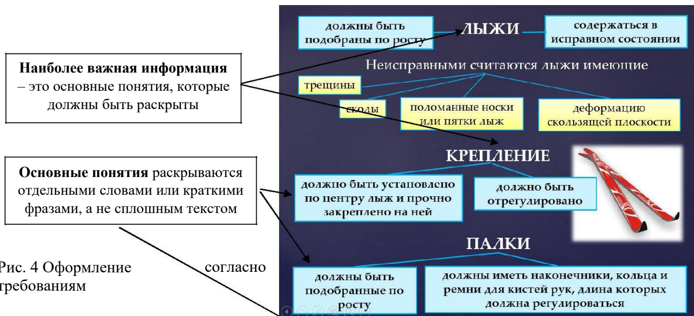
Рис. 4 Оформление требований