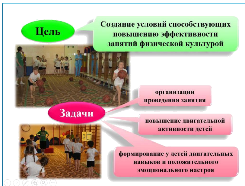
Рис. 6 Создание логического ударения с помощью цвета, размера, яркости, расположения

11. Время глаголов должно быть везде одинаковым.