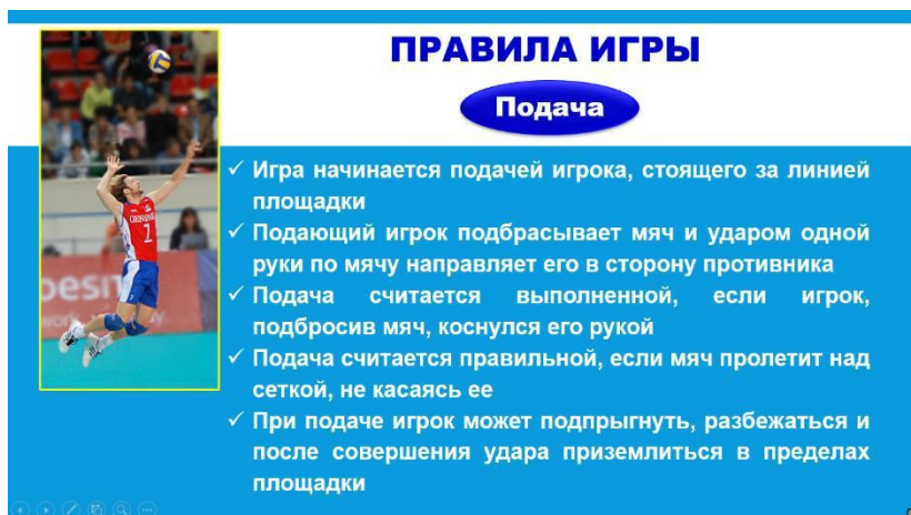
Рис. 3 Расположение текста по ширине