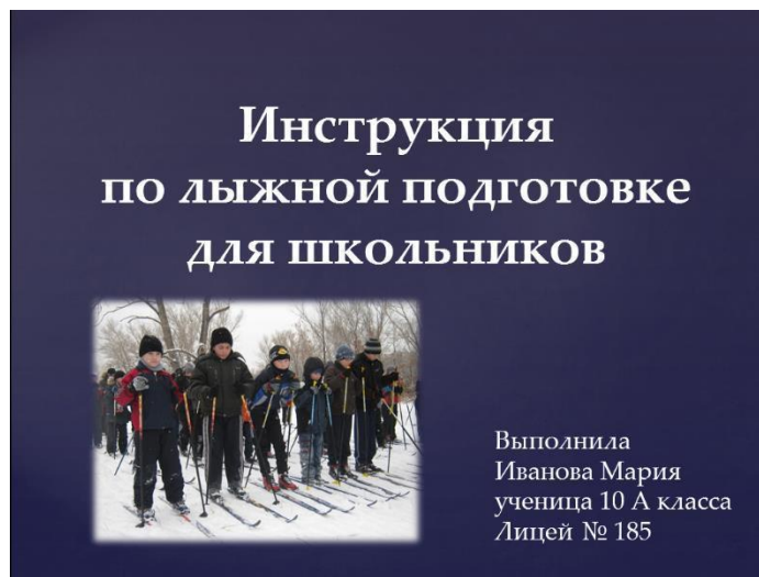
Рис. 1 Оформление 1 слайда, титульный лист