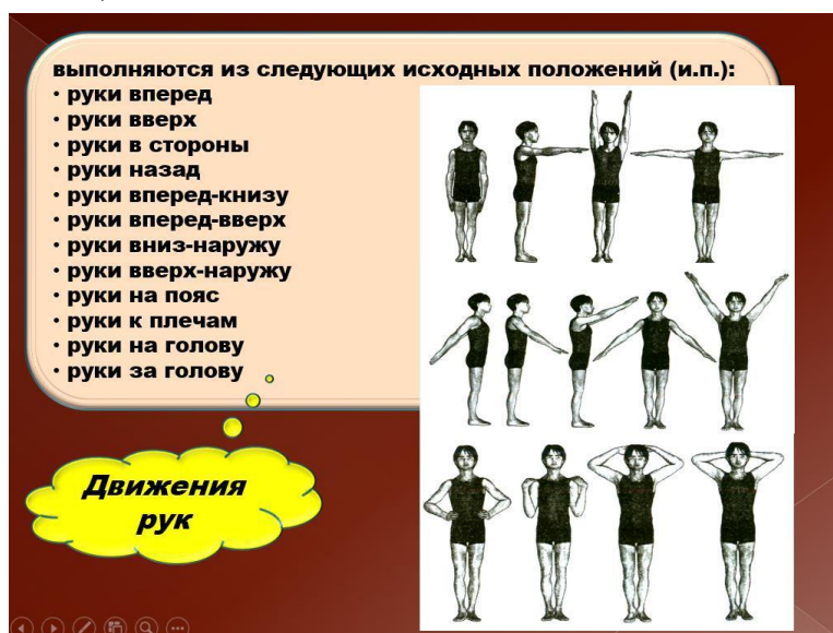
Рис.9 Оформление слайда с использованием 4-х цветов