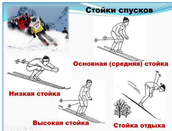
Рис.2 Оформление слайда с картинками и надписью