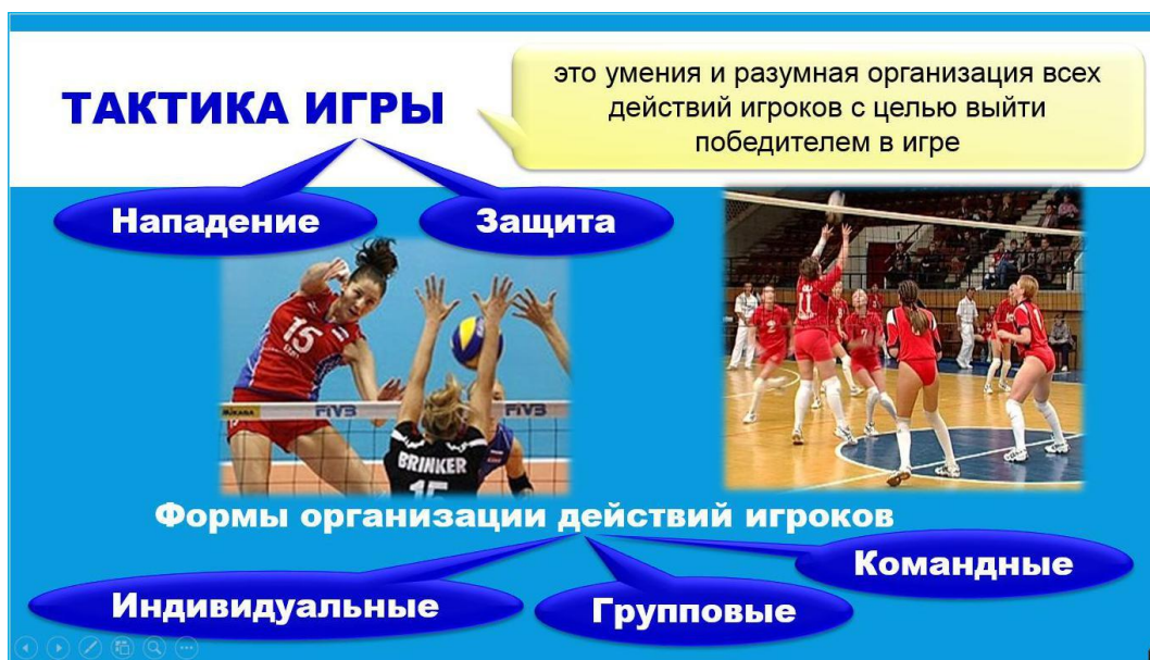
Рис. 8 Оформление слайда с использованием 3-х вариантов шрифта.